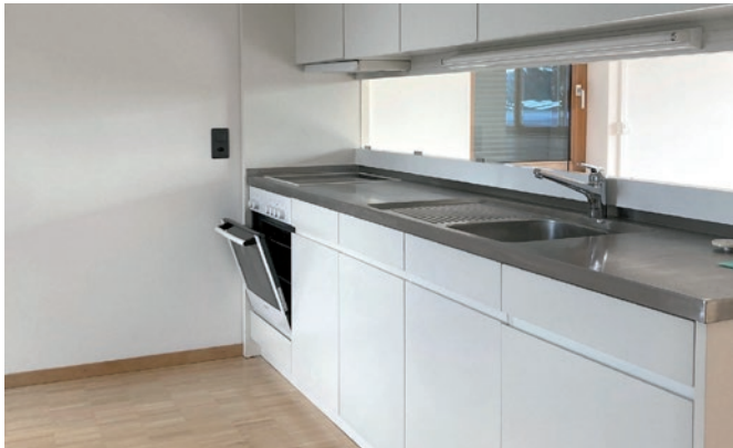
Die Küche vor der Sanierung