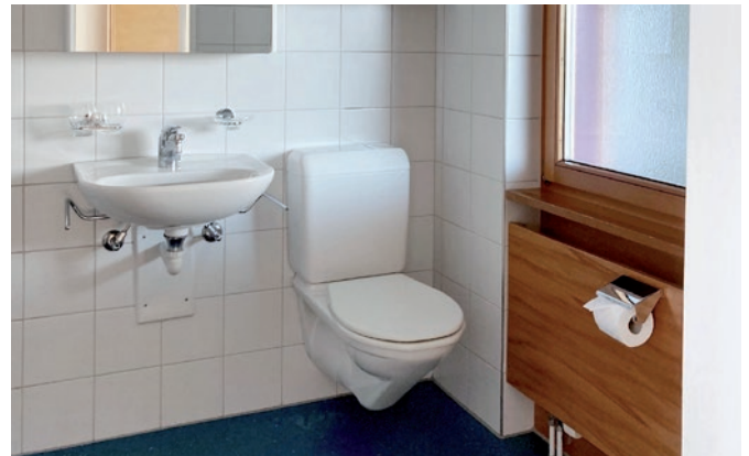
Das alte Badezimmer vor der Sanierung

Wir werden bestrebt sein, dass die Lärmemissionen möglichst gering sind und nur in vorbestimmten Zeitfenstern erfolgen. Wenn alles nach Plan verläuft, werden im Sommer 2027 die Sanierungsarbeiten abgeschlossen sein.