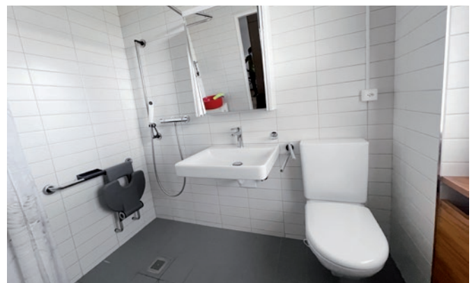
und nachher mit neuen Sanitärinstallationen

Im Namen der Bauherrschaft danken wir Ihnen, liebe Mieterinnen und Mieter, ganz herzlich für Ihr Verständnis und Ihre Geduld während der Bauzeit!