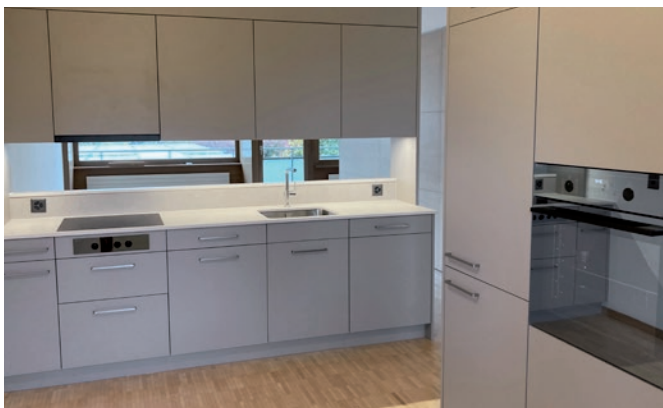
und danach mit neuen Geräten