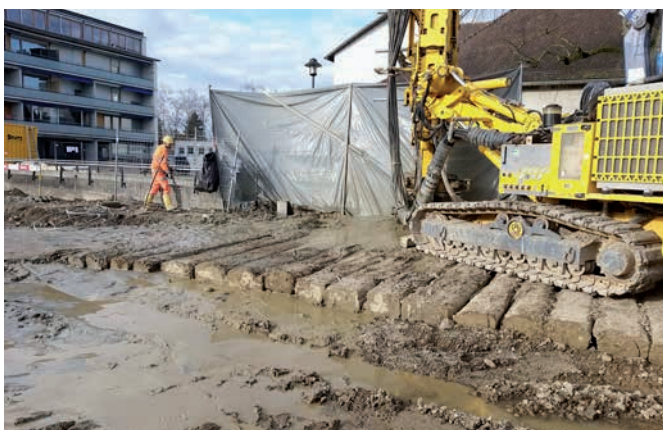
Bohrung für Rühlwand