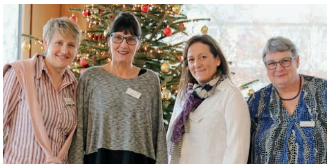
Naujahsapéro, Team Betreutes Wohnen