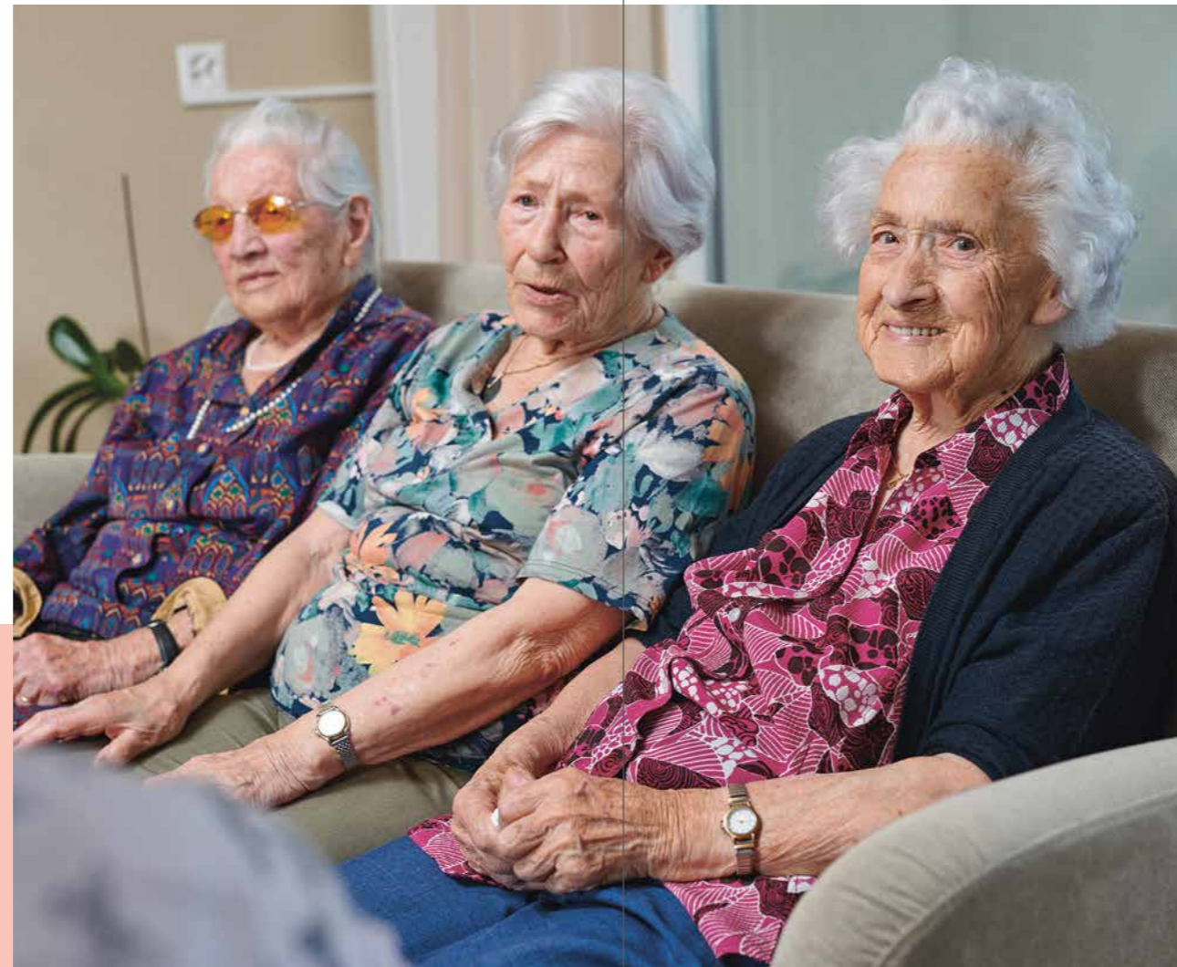
In den Aufenthaltsräumen ist gute Laune Programm und stets Platz für Besuch.

In vier Wohnbereichen leben je 24 bis 28 Bewohnerinnen und Bewohner. Sie treffen sich in Aufenthaltsräumen, empfangen Besuch oder verweilen in gemütlichen Sitzecken. Wer im Pflegezentrum lebt, kann sein Zimmer mit eigenen Möbeln, Bildern, Pflanzen usw. einrichten. Die meisten Zimmer verfügen über einen Balkon, WC / Lavabo sowie TV- und Internetanschluss. Einzelne sind mit einer eigenen Dusche ausgestattet. In allen Räumen ist die notwendige Pflegeinfrastruktur vorhanden.